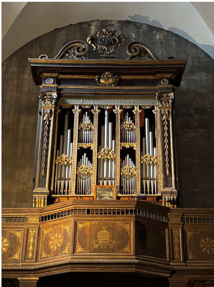
Organo di Domenico Cacioli (1687), Paolino Bertolucci (1854), Pietro Paoli (1877) e Filippo Tronci (1903) Lucca, chiesa di San Pietro Somaldi