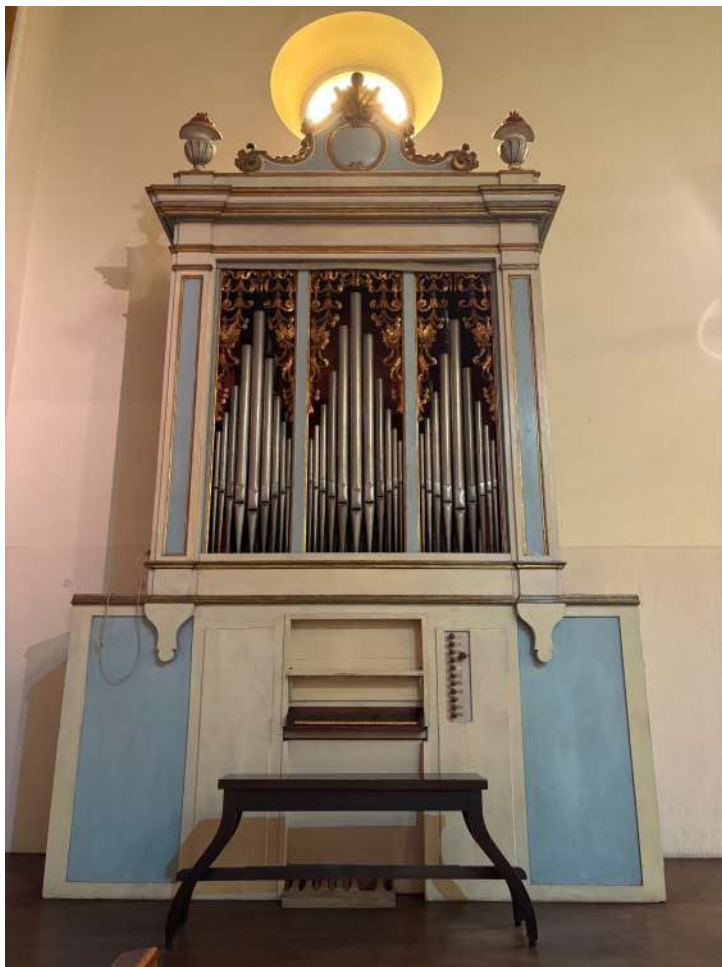
Organo di Domenico Pucci (1823) , già nella chiesa di San Girolamo in Lucca Massarosa (LU) - Piano di Conca, chiesa di San Francesco d'Assisi