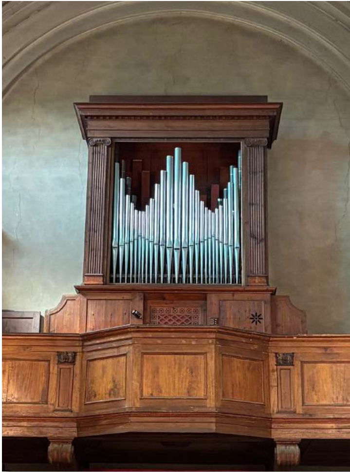
Organo di Odoardo Landucci e figli (1869) Farneta (LU), chiesa di San Lorenzo