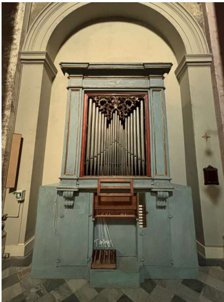
Organo di Michelangelo Crudeli (1784) Mutigliano (LU), chiesa dei SS. Ippolito e Cassiano