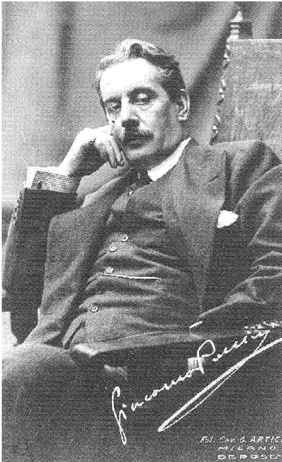
Una celebre foto autografata di Giacomo Puccini