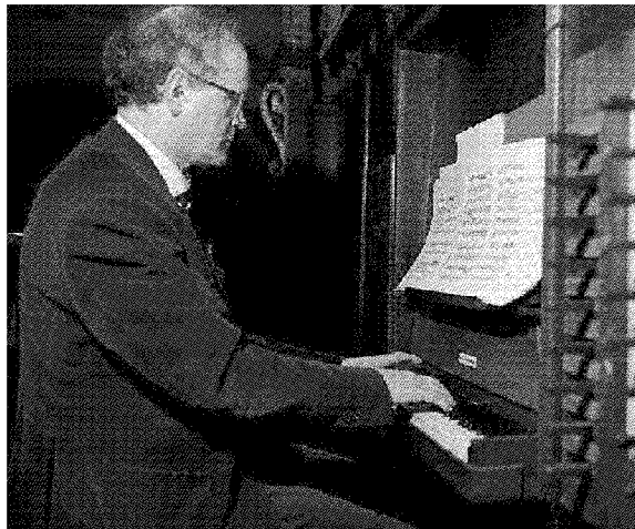
L'organista olandese Liuwe Tamminga che a maggio eseguirà i brani inediti di Puccini